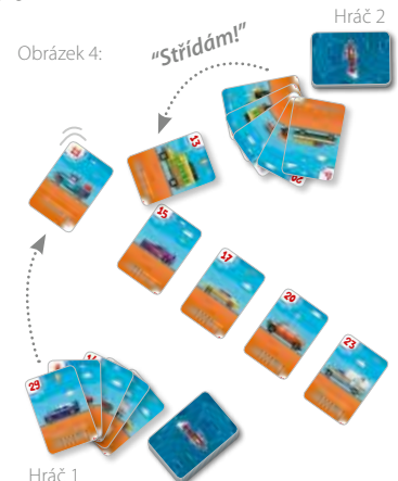
Obrázek 4: Hráč 1 umístil kartu č.13, hráč 2 si všimne, že má kartu č.13 (je větší než 11 a menší 15). Tak uloží kartu mezi 11 a 15, čímž «Vystřídá» aktivního hráče a získá tah.

Pokud žádný z hráčů nemůže položit kartu (všichni oznámili: Končím!), pak se karty vyřadí ze hry. Nové kolo začíná aktivní hráč otočením vrchní karty ze své kopy.