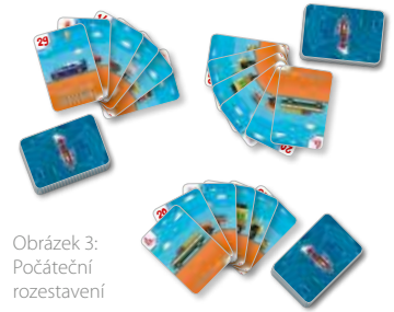
Obrázek 3: Počáteční rozestavení

Odstraňte všechny karty bez čísel (např. Sanitky). Zbývající karty se rozdělí mezi všechny hráče stejným počtem a otočí směrem dolů. Každý hráč si vezme své karty a položí si je před sebe na hromádku. Abyste zajistili stejný počet karet pro každého hráče, můžete vyřadit posledních pár karet. Hra začne tím, že si každý hráč vezme ze své hromádky 6 karet.